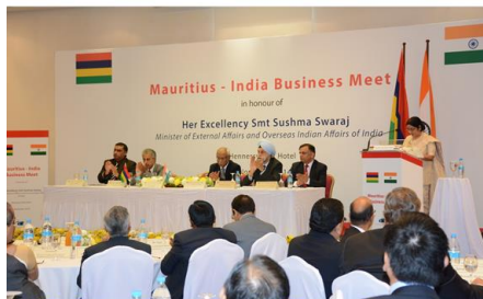
HE Smt Sushma Swaraj addressing Members of the business community at a meeting held at Hennessy Park Hotel on 3rd November 2014

In the context of the visit of Her Excellency, Smt Sushma Swaraj, Minister of External Affairs and Overseas Indian Affairs of India, a business forum was organized by the Board of Investment and the Mauritius Chamber of Commerce and Industry on 3 November 2014 at Hennessy Park Hotel in Ebène.