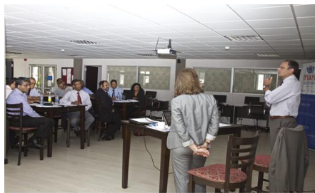
Des membres de la profession légale en session de formation organisée au siège du Bar Association