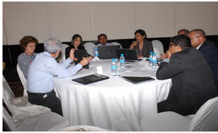
Des groupes de travail ont été constitués pour identifier les contraintes à l'exportation

Le NES vise à relever les défis et opportunités liés au commerce international, à identifier de nouvelles opportunités dans la chaîne de valeur et à accroître la convergence et la cohérence des politiques de développement économique. Il a aussi pour but de formuler une feuille de route pour l'exportation des secteurs clés à fort potentiel de développement et établir des liens plus formels entre le commerce et d'autres facteurs de développement.